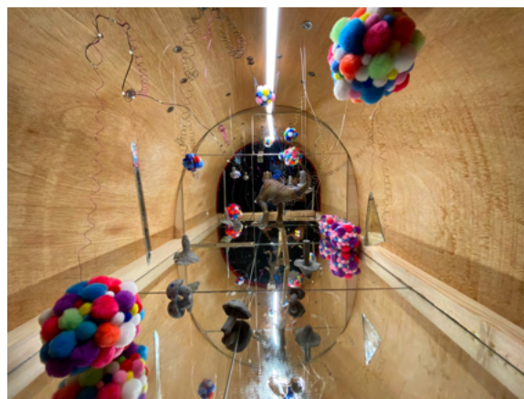
Abbildung 8: Gestaltung aus dem papierAtelier von Friederike Waimer

Adventsfenster. Das theaterAtelier sprang ein, da die übliche Weihnachtsfeier für die Living Museum Wil Kunstschaffenden entfallen muss. Sie verteilten liebevoll gestaltete Weihnachtssäckchen für alle Anwesenden im Haus, welche auch noch mit schönen Engels-Geschichten beglückt wurden.