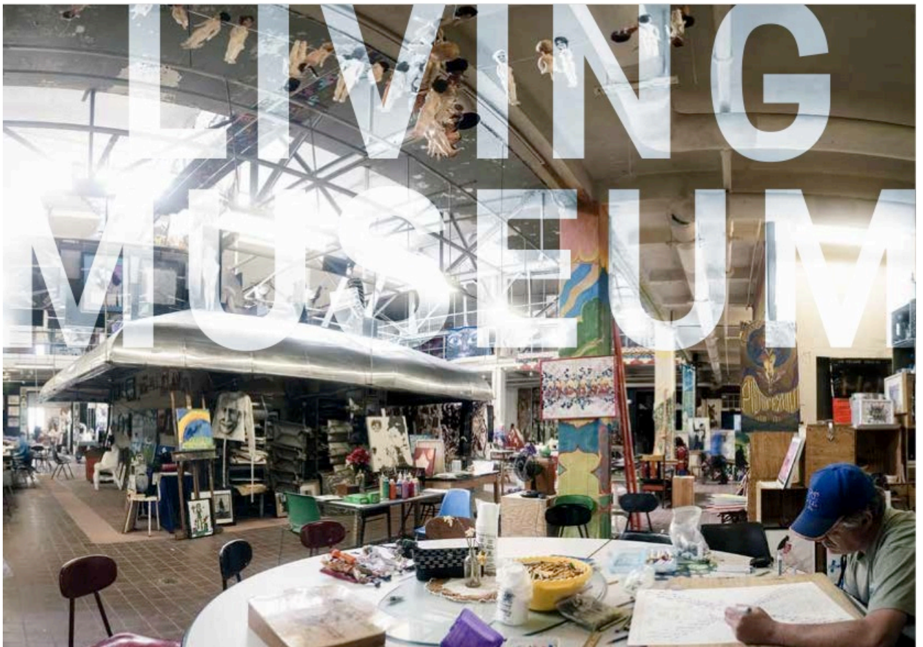
Abbildung 1: Living Museum New York