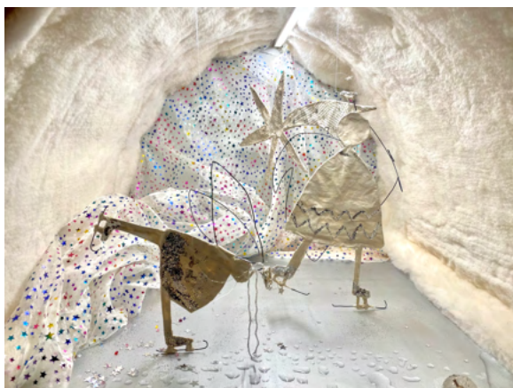
Abbildung 7: Gestaltung aus dem textilAtelier unter künstlerischer Leitung von Beatrice Abbühl

Anstelle des traditionellen Adventsmarktes beteiligten sich die Ateliers-Living Museum an der Gestaltung eines Adventsweges am Dorfplatz, welches von naturAtelier der PSGN initiiert und umgesetzt wurde. So wurden 24 kleine Boxen gestaltet, die Tag für Tag geöffnet und der Öffentlichkeit vorgeführt wurden. Einige der Living Museum Kunstschaffenden gestalteten sehr fantasievoll und weihnachtlich unterschiedliche