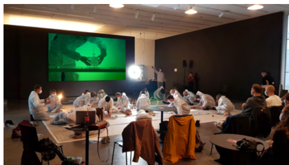
Abbildung 5: Living Museum Performance auf dem Mental Health Day

Anlässlich des Welttages der psychischen Gesundheit am 10. Oktober 2020 organisierte das Kunstkollektiv dis-order einen Tag der Begegnung zweier allzu oft als unterschiedlich empfundener Realitäten und brachte Themen von psychischen Unbehagen in die Räume der zeitgenössischen Kunst der Löwenbräukunst. Während des einjährigen Forschungsprojektes hat der Künstler Fogaroli eine europaweite Reise zu verschiedenen psychiatrischen Einrichtungen, ihrer Geschichte und aktuellen Programmen zur Stabilisierung der psychischen Gesundheit unternommen. Die Forschungen des Künstlers, die die Immaterialität und Immaterialisierbarkeit von psychischen Erkrankungen untersuchen, führten zu einigen aktuellen Fragen: Sind wir immer noch in der Lage, einen Prozess der Entstigmatisierung und Neubesinnung auf psychische Erkrankungen einzuleiten? Wie betrachten wir den binären Zustand, der Normalität und Abweichung voneinander unterscheidet? Durch die Analyse verschiedener geographischer und kultureller Kontexte hinterfragt die Ausstellung die Stigmatisierung und das Tabu, die oft mit der psychischen Krankheit verbunden sind.