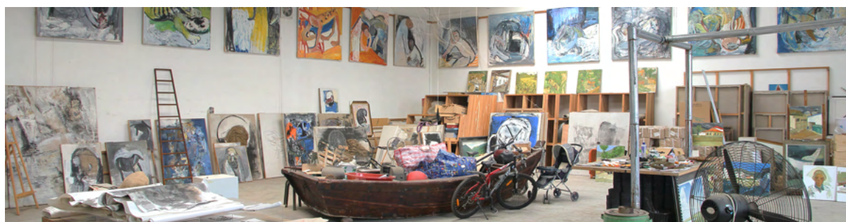
Abbildung 4: Bild von Livato-Website

Der Vorstand vom Livato Olten hat sich mit Vertreterinnen der Solidaris Stiftung getroffen, es ist aber nicht zu einer engeren Zusammenarbeit gekommen. Der Livato Vorstand