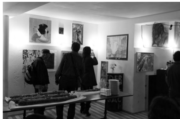
Abbildung 10: Ausstellung im Schwarzen Engel St. Gallen

Alle interessierten Kunstschaffenden der Tagesstätte hatten die Möglichkeit, im Schwarzen Engel St. Gallen Kunstwerke zu zeigen und zu verkaufen. Künstler konnten auch vor Ort Live-Paintings erstellen, um den Gästen ihr Kunstschaffen im Prozess näher zu bringen. Zur Vernissage kamen viele interessierte Personen, um die Arbeiten in Augenschein zu nehmen.