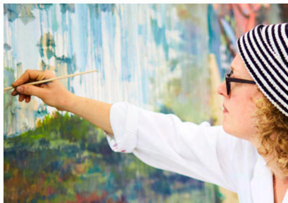
Abbildung 6: Bild des digitalen Flyers

Adventsfenster. Das theaterAtelier sprang ein, da die übliche Weihnachtsfeier für die Living Museum Wil Kunstschaffenden entfallen muss. Sie verteilten liebevoll gestaltete Weihnachtssäckchen für alle Anwesenden im Haus, welche auch noch mit schönen Engels-Geschichten beglückt wurden.