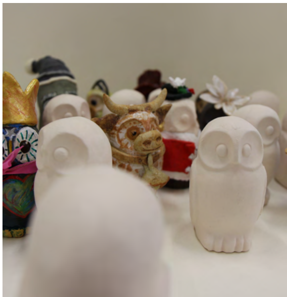
Abbildung 11: Ausschnitt aus bereits angefertigten Eulen, keramikAtelier, 2020

Im KeramikAtelier des Living Museum in Wil kann mit Ton auf verschiedenste Weise modelliert werden. So können auch verschiedene Gipsformen als Vorlage genutzt werden, um ein Objekt zu erschaffen. Eine dieser