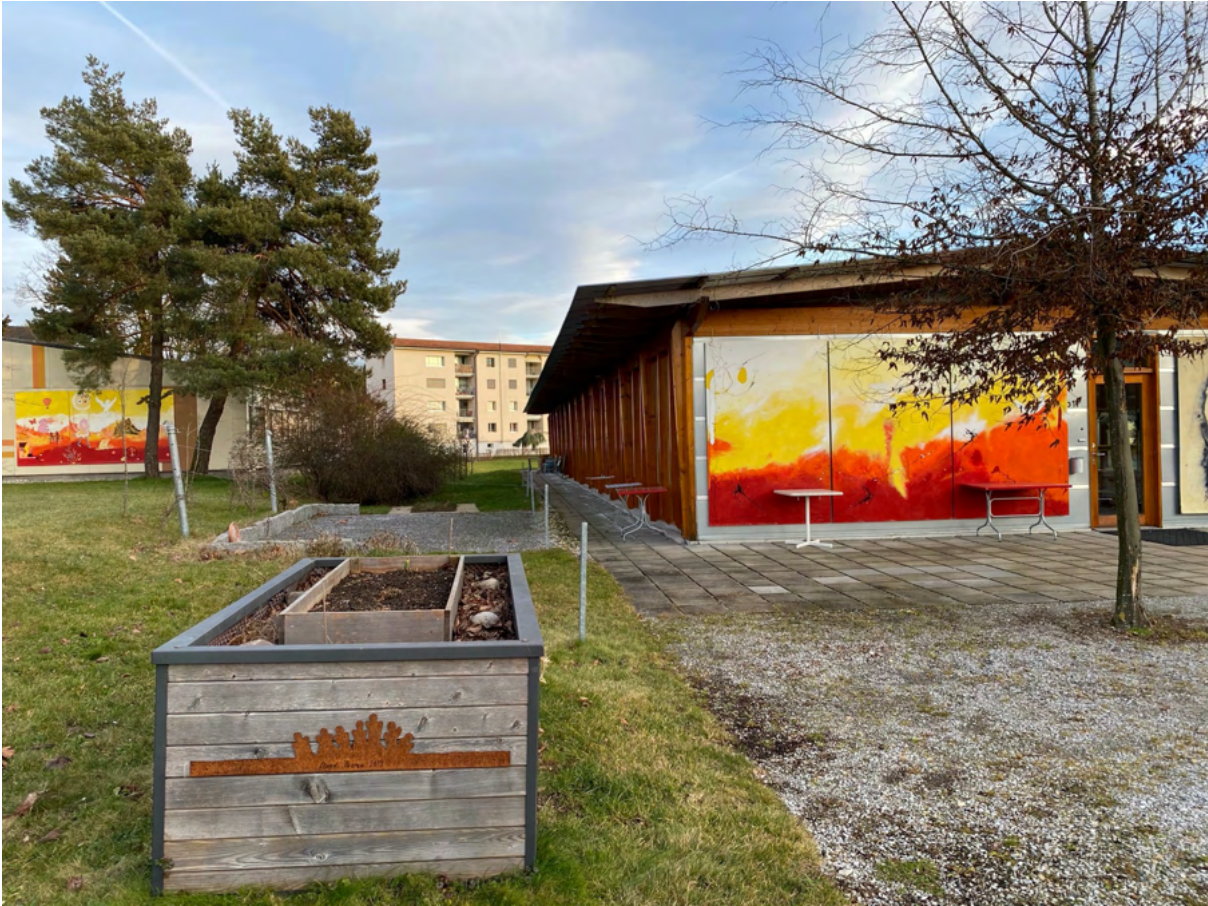
Abbildung 9: Tagesstätte Wil, SG